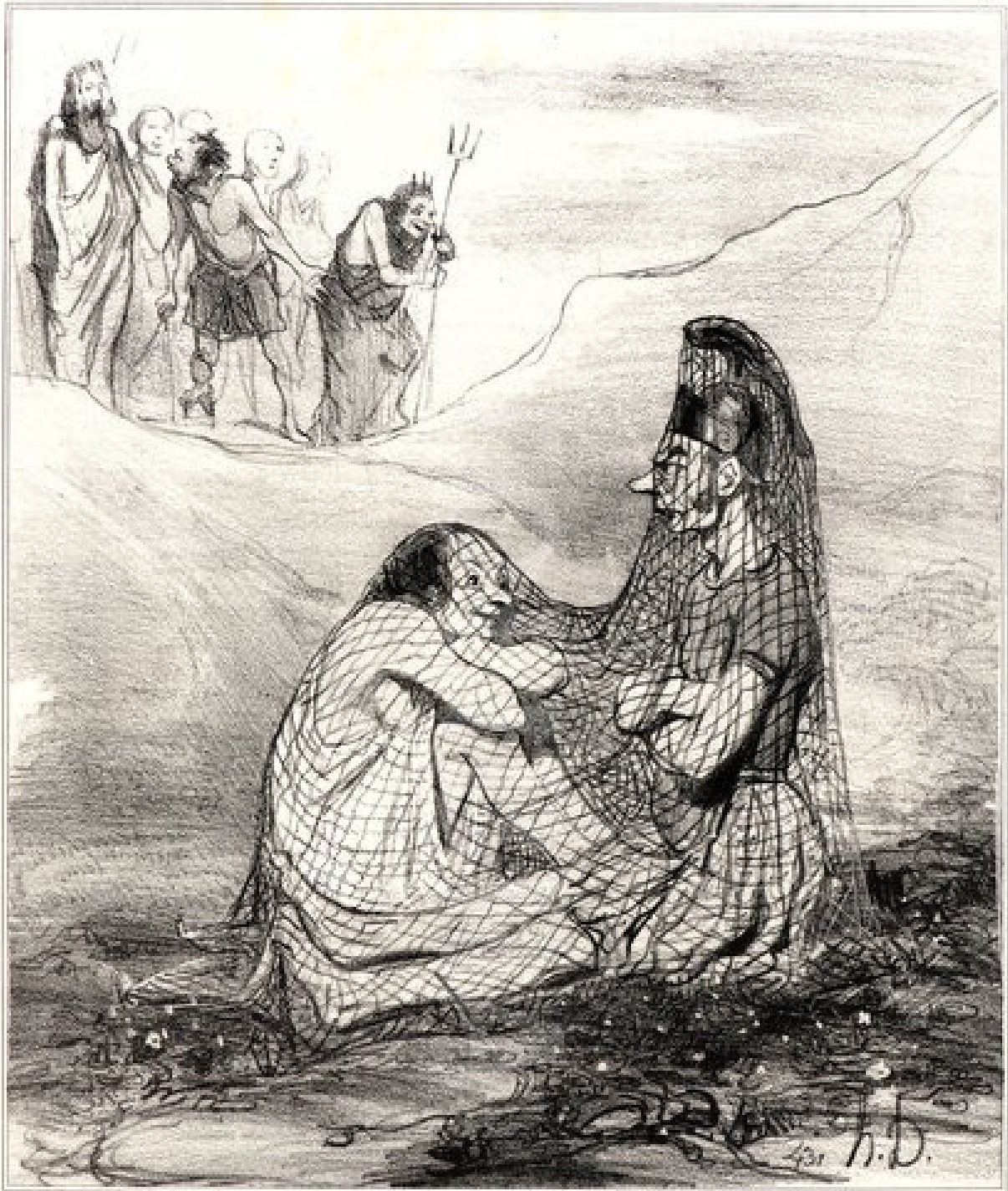
Unes d'après P. de Valenciennes.