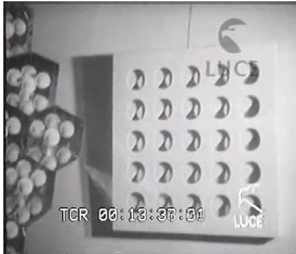
fermo-immagine del filmato "Bianco+Bianco" dell'Istituto Luce

Tre tele tagliate e sovrapposte 100x100 cm