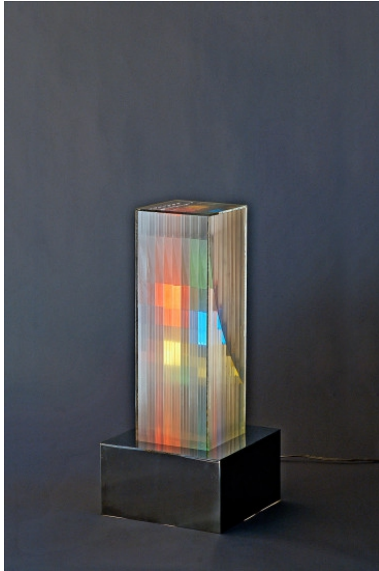
Strutturazione cromatica 1961