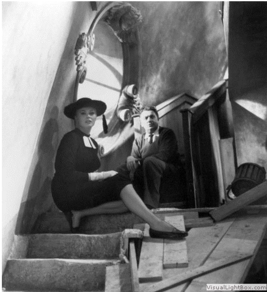
Anita Ekberg e Federico Fellini