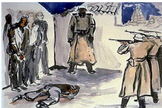
Renato Guttuso (Bagheria, 1911 – Roma, 1987)